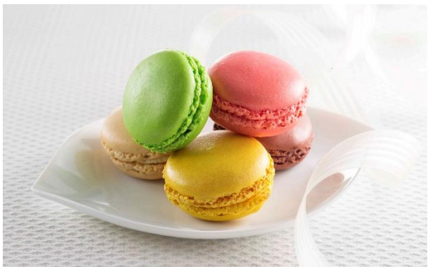
ダロワイヨを代表する商品 「マカロン」