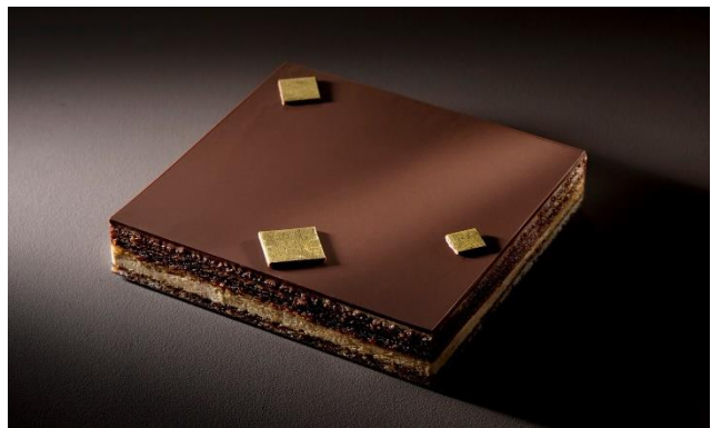
パリ オペラ座の舞台をイメージした ダロワイヨのチョコレートケーキ「オペラ」