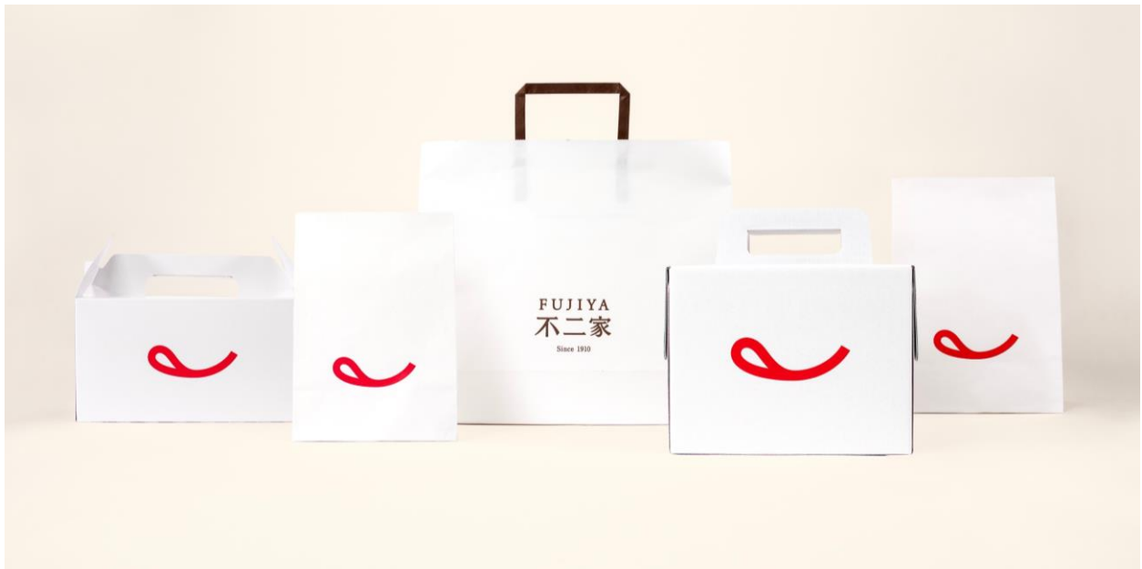
▲2023 年 9 月にリニューアルした不二家洋菓子店の新 VI

株式会社不二家（本社：東京都文京区、社長：河村 宣行）より、2023 年 9 月に刷新した不二家洋菓子店の新 VI（ビジュアルアイデンティティ）が台湾の国際デザイン賞である「GOLDEN PIN DESIGN AWARD」において「年間最優秀デザイン賞」を受賞したことをご報告いたします。