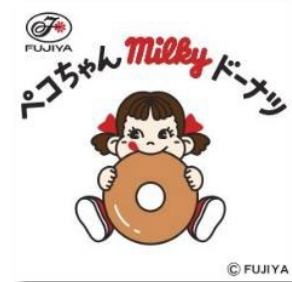
▲ステッカーイメージ