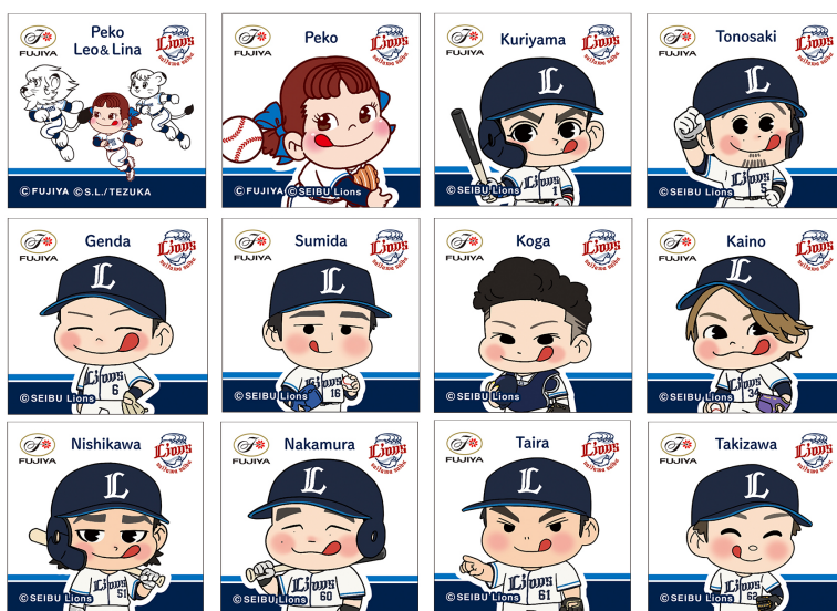
▲ステッカーイメージ(全12種ランダム)

【詰め合わせ内容】 ミルク5粒 / カントリーマアム(バ ニラ)4枚 / ホームパイ4枚(2包)