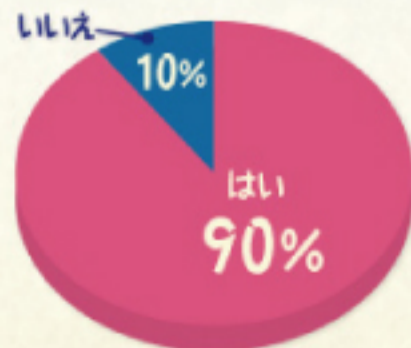
ペットは家族の一員ですか？

また、「いいえ」と回答された方が飼っているペットの種類を見ると、金魚や熱帯魚などの魚を飼っている方が見受けられました。上記の回答にもあるように、観賞用として魚を飼っている方も多いのかもしれません。